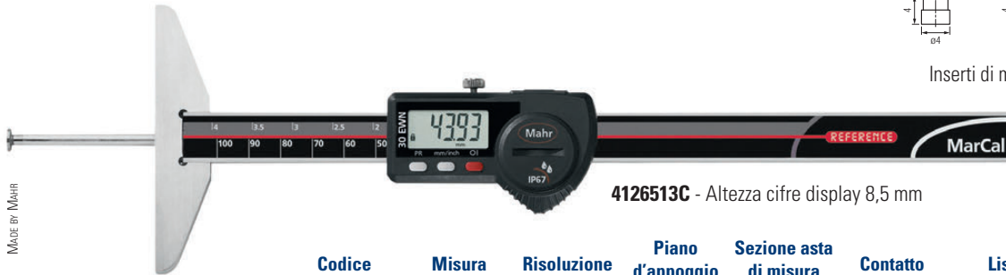
4126513C - Altezza cifre display 8,5 mm